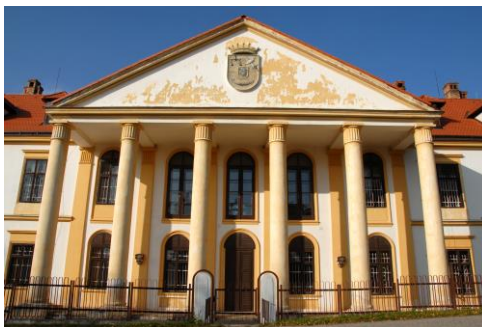
Centrum sociálnych služieb Rohov

Poskytovateľ celoročnej pobytovej formy sociálnej služby: